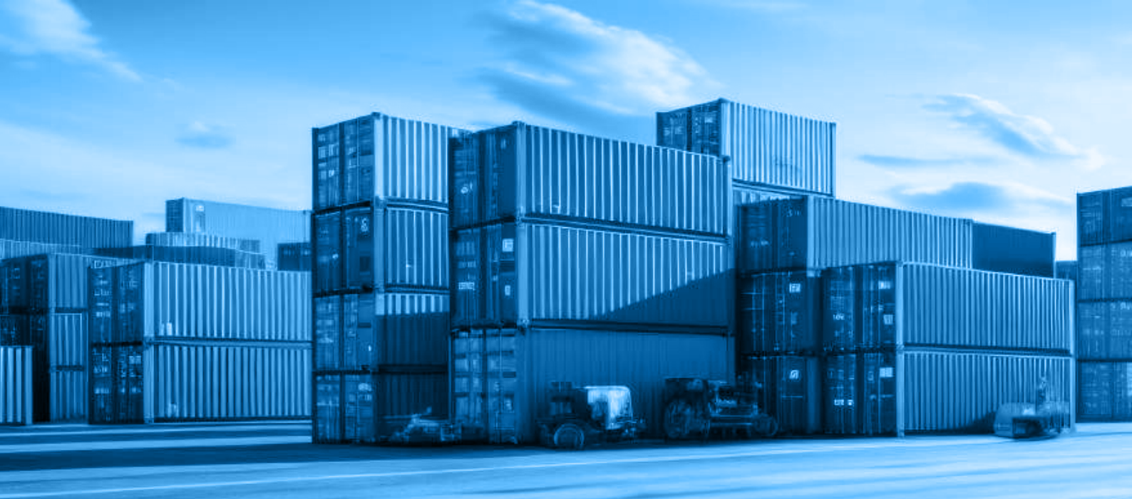
TABLE OF CONTENTS